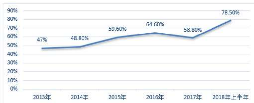
图 2：最终消费对 GDP 增长的贡献份额（%）