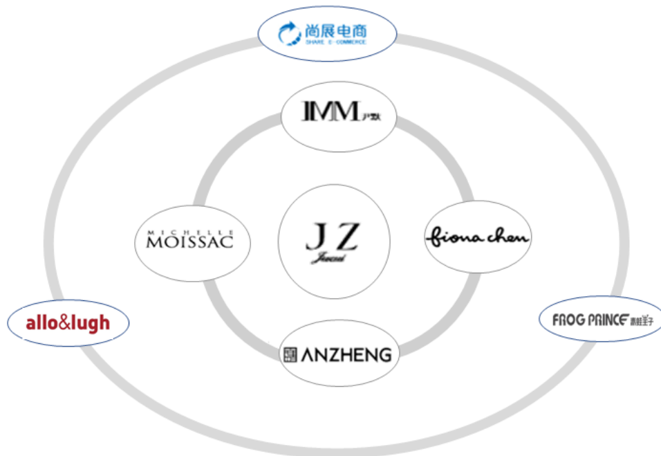
公司品牌管理矩阵

公司相继创立了“玖姿”、“尹默”、“安正”三大各具特色、相互补充的中高档时装品牌，并于 2014 年下半年在中淑女装细分领域分别收购了“摩萨克”与“斐娜晨”两大新兴时装品牌，进一步增强了公司品牌管理的丰富度。同时，大中华区合资经营韩国儿童用品品牌“ALLO&LUGH”，以及参股经营中国十大童装品牌之一“青蛙王子”和“可拉.比特”。此外，控股子公司礼尚信息为国内外著名品牌的全渠道电子商务运营商，以专业的营销和运营帮助海内外母婴、食品保健、运动户外、宠粮家居等行业知名品牌在国内电商全渠道实现快速增长，并提升品牌在中国市场的知名度和美誉度。由此，公司形成了一个结构稳固、风格多样、定位互补的品牌管理矩阵。